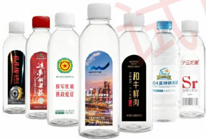
*部分合作企业定制水