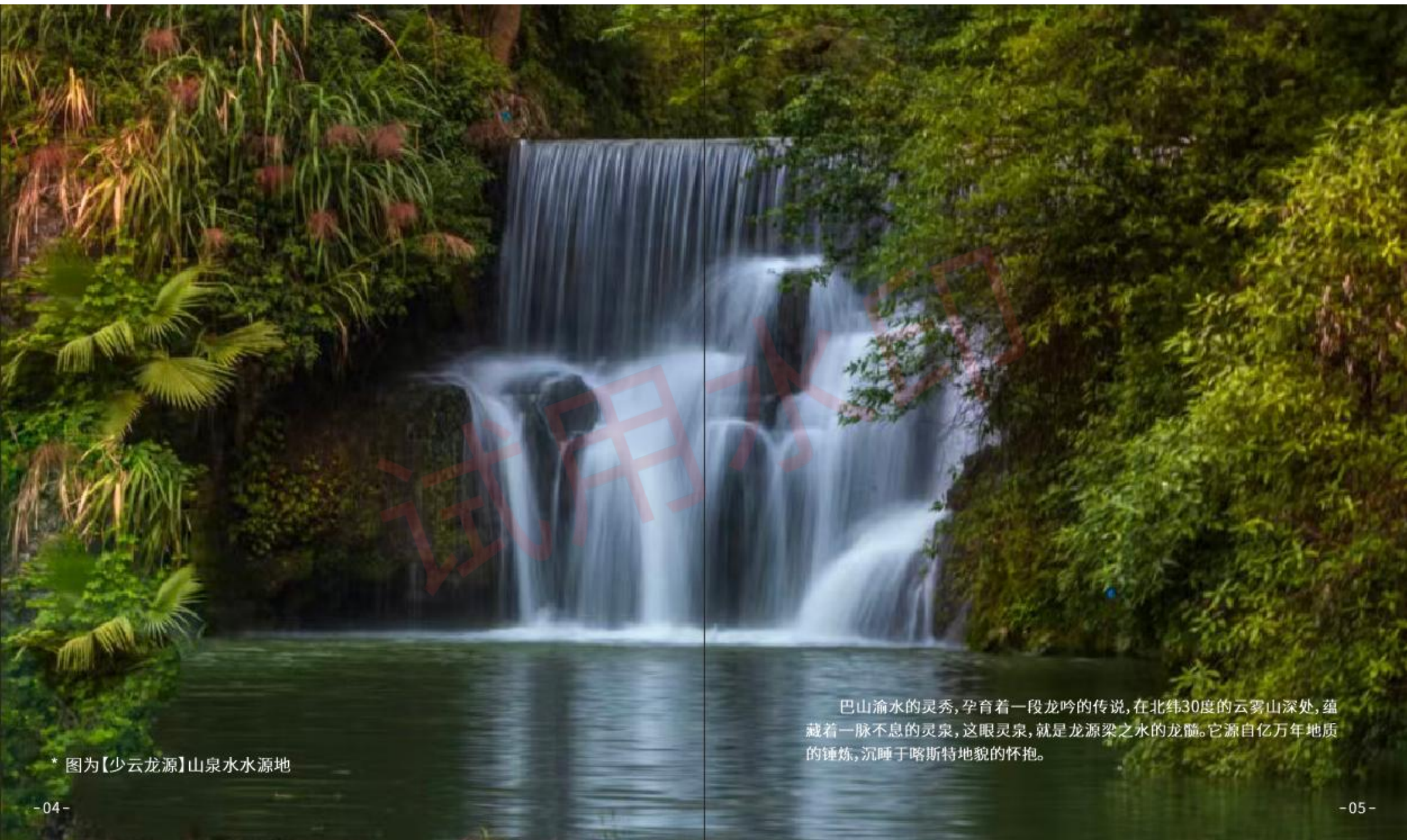
* 图为【少云龙源】山泉水水源地

巴山渝水的灵秀,孕育着一段龙吟的传说,在北纬30度的云雾山深处,蕴藏着一脉不息的灵泉,这眼灵泉,就是龙源梁之水的龙髓。它源自亿万年地质的锤炼,沉睡于喀斯特地貌的怀抱。