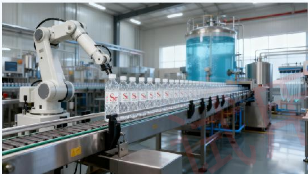
“零接触”智能化生产